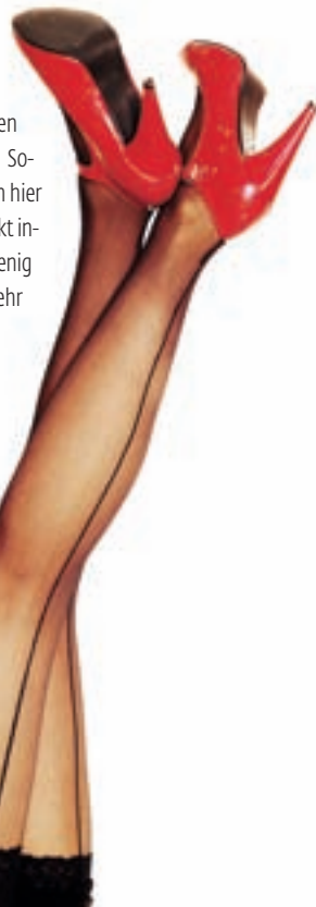
Styling: Sabine Janke, Neuss

Die Visagistin setzt auf die beiden Hauptfarbtöne Rot und Schwarz. Sowohl Mund als auch Augen werden hier stark betont. Das Model wird perfekt inszeniert: sexy, gleichzeitig unschuldig und meist als ein wenig ungeschickt. So wurden klassische Pin-up Girls damals sehr häufig dargestellt.